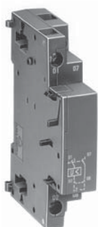
UA4 - HK